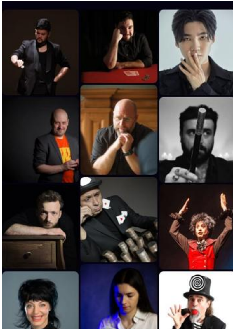
Algunos artistas que podremos ver en Magialdia 2025.

Cada año, Magialdia transforma Vitoria-Gasteiz en un gran escenario donde la ilusión toma el control. Consulta aquí toda la programación: galas, magia de calle, conferencias, exposiciones y actividades para todos los públicos. Descubre cuándo y dónde vivirás la próxima gran sorpresa. ¡No te pierdas nada!